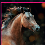
Diamante ANJO COLONO FAR (DIAMANTE AZUL) X DENOVAS MELODY 2017 AMERICAN AZTECA HORSE BUCKSKIN STALLION