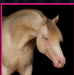
2018 AQHA AMBER CREAM CHAMPAGNE STALLION Triple FROZEN Dunit Homozygot Champagne TRIPLE JET CEE JAY X BE DUNIT COLD ICE