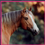
2002 AQHA PALOMINO STALLION CHANTS LUCKY MAN MACS LUCKY MAN X CHANTS BABE ADAIR