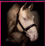
Best of 2016 AQHA PERLINO STALLION Spook BEST SPOOK X WIMPYS LITTLE LOLITA