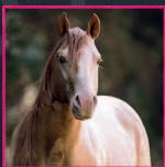
2014 AQHA GOLD CHAMPAGNE STALLION SW CHAMPAGNE FANTASY X ZOES RUGGED FEATHER RUGGED IN GOLD