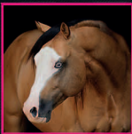
The 2017 AQHA/APHA BUCKSKIN STALLION MOBS CAPONE HF MOBSTER X GOLDEN SECRET WEAPON