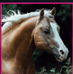
Little CHEX=CASH 2008 AQHA PALOMINO STALLION BIG CHEX TO CASH X CEE NIFTY CASH