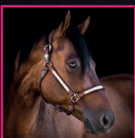
Magic EINSTEIN 2009 AQHA STALLION EINSTEINS REVOLUTION X CHICS LITTLE LENA